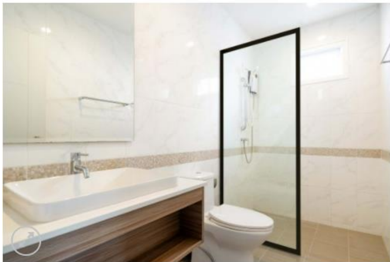
*Imágenes referenciales, sin escala